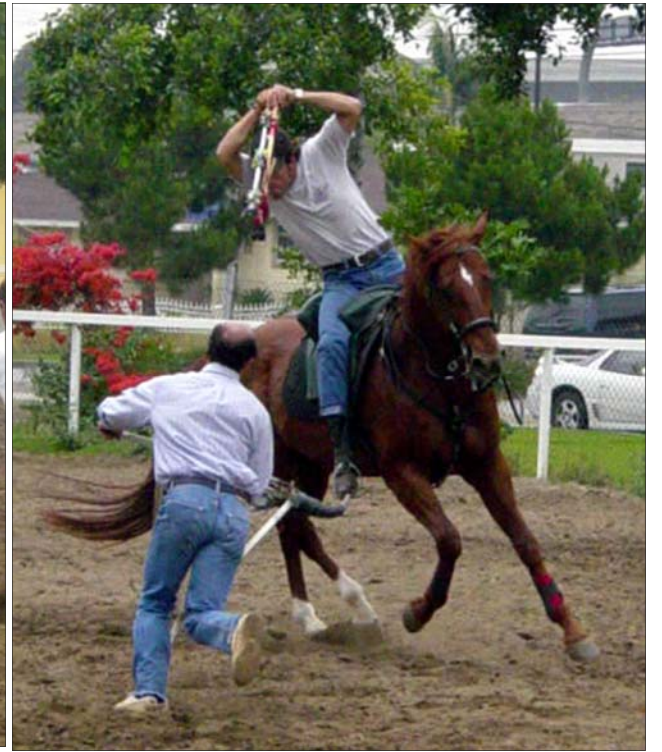
Na Coudelaria Agualva é só trabalho. Para todas as coudelarias uma temporada de responsabilidade a de 2006